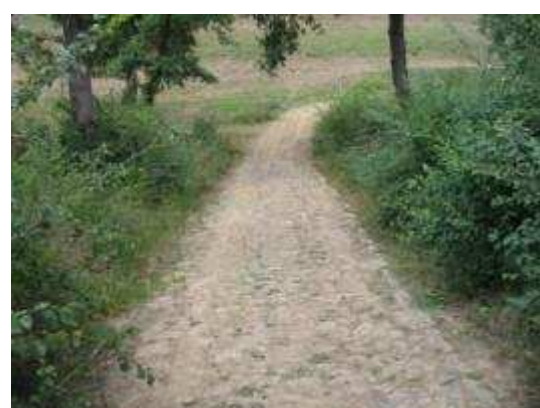
Romeinse weg bij Casale