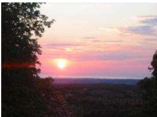
uitzicht op zee, spectaculaire zonsondergang