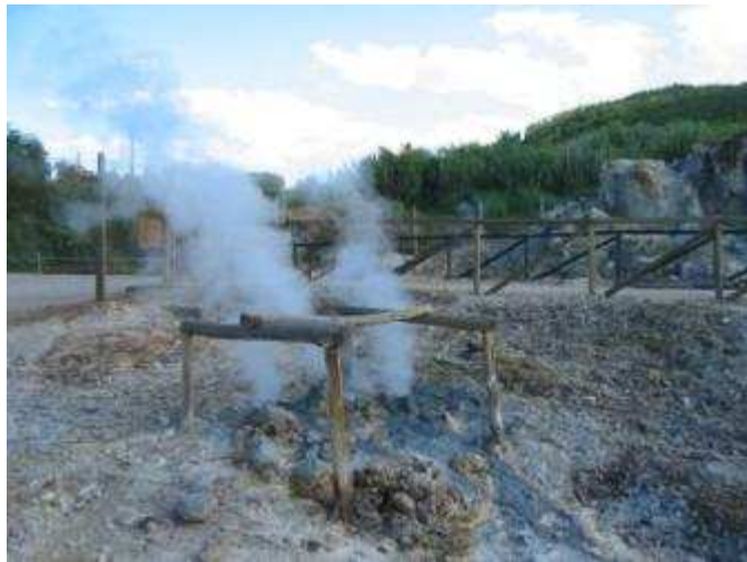
Geisers bij Lardarello (niet op slippers proberen)