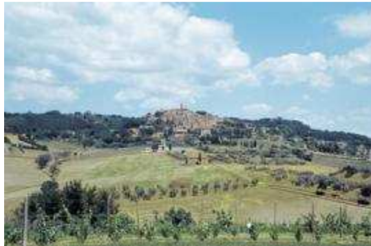
Casale (komende vanuit Bibbona)