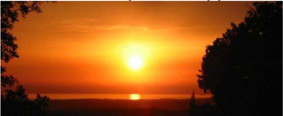
oude vulkanen bij Lardarello