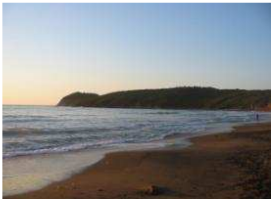
Golfo di Barati