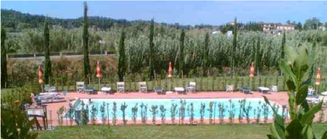
Deze foto is genomen in 2008, inmiddels is de begroeiing veel dichter en mooier.